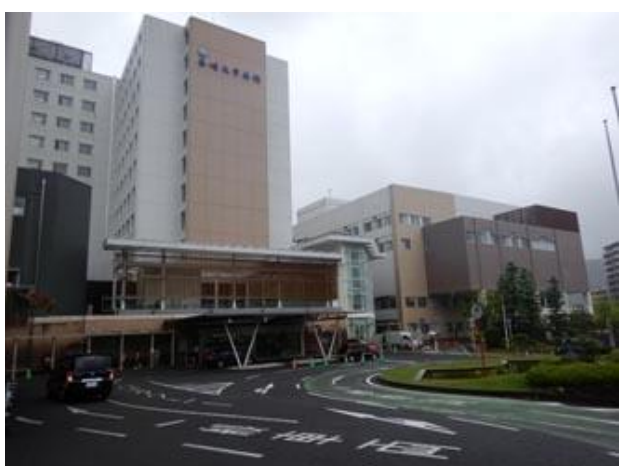
①大学病院正面の右側へ進む