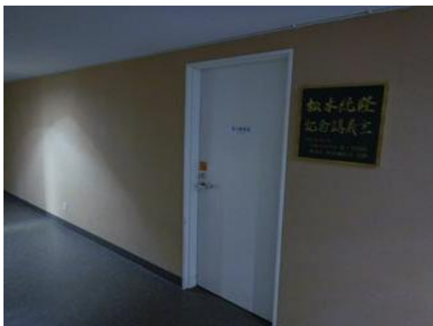
⑤左手に会場入り口