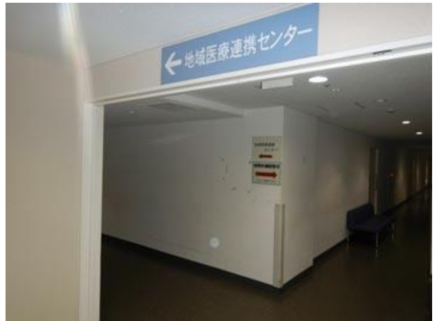
④一つ目の角を左へ進む