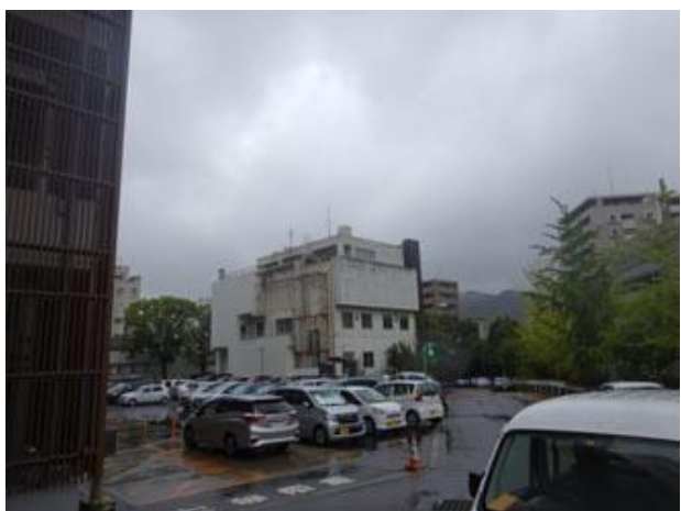
③建物を通り過ぎて