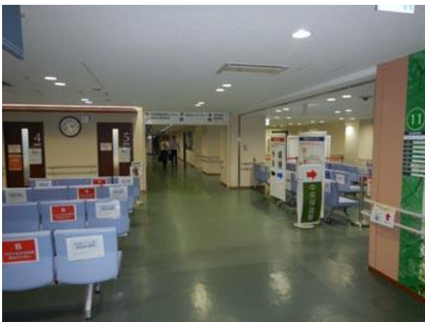
③突き当りを左へ進む