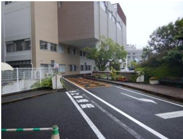
②建物手前を通り奥に進む