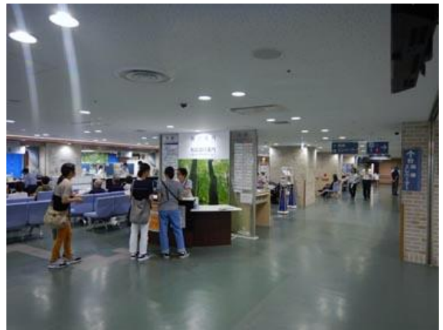
②正面玄関に入って、まっすぐ進む